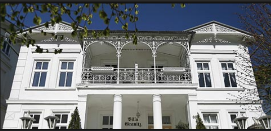
Villa Granitz in Sellin Urlaub in mitten der Bäderarchitektur von Rügen